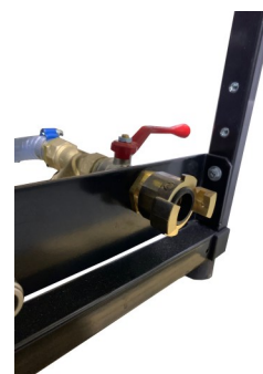
Raccord 'Tête de chat'