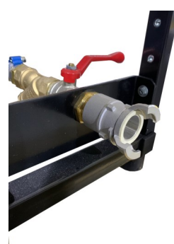
Raccord Sym. 20